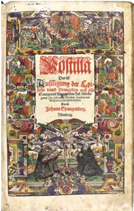
Titelseite einer Lutherbibel

In der Göttweiger Bibliothek befindet sich bis heute ein überraschend großer Bestand an Lutherbibeln, die in der Vergangenheit als „Verbotene Bücher“ galten.