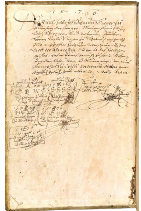
Handschriftliche Notizen in einer Lutherbibel

Unter der historischen Bezeichnung „Libri Prohibiti“, lateinisch für „Verbotene Bücher“, wurden früher in Bibliotheken alle Arten von reformatorischen Büchern verstanden. Diese wurden meist versperrt gelagert und waren nur einem ausgewählten Personenkreis zugänglich.